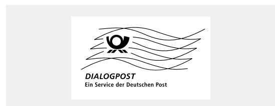
Muster Frankierwelle DIALOGPOST